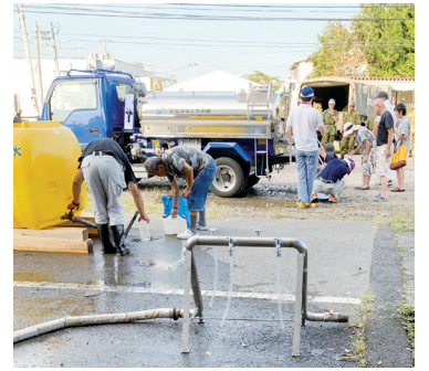
給水所設置の様子